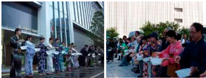
2017 年の打ち水大作戦の様子