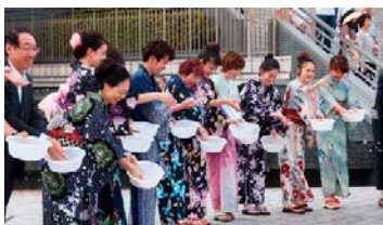
<2016 年の打ち水大作戦の様子>

16:15~ 氷の彫刻 実演開始 タワーズガーデン 16:30~ 太鼓演奏 タワーズガーデン 16:45~ オープニングセレモニー タワーズガーデン 17:15~ 打ち水スタート タワーズガーデン・各ゾーン