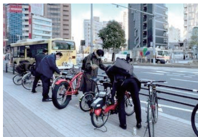
1月26日 都市再生委員会でのタグ貼り