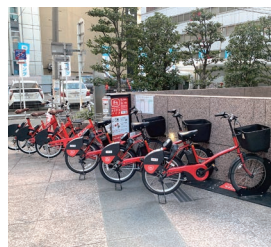
センチュリー豊田ビル

大名古屋ビルディング入居企業対抗の綱引き大会を実施しました。参加企業内でのコミュニケーション活性化や企業間の交流促進に加え、周辺からも観戦者が集まりにぎわい創出に寄与しました。