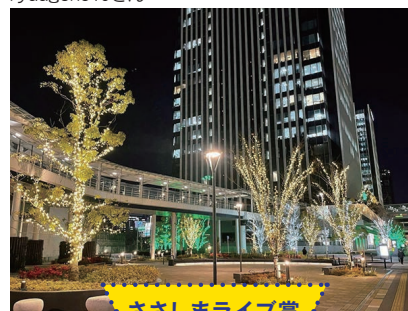
ささしまライブ賞