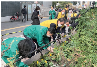
12月1日 花植えの様子

11月28日～12月2日にかけて、おもてなし花だんの花植えを実施いたしました。中央花壇においては、12月1日に花だんのサポーターの皆さまや名駅ロータリークラブの皆さまと共に花植えを実施しました。また『都心の生きもの復活事業』では継続的にモニタリングを続けてきましたが、以前に比べ蝶の姿を見かけるようになりました。皆様もぜひ足を止めて花壇を見てみてください。