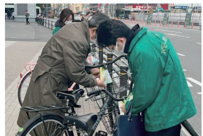
1月20日 地域活動委員会でのタグ貼り