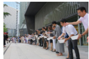
大名古屋ビルディング前