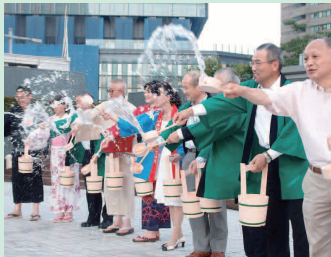
打ち水大作戦(昨年度)