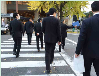
現地調査や課題抽出ミーティングの様子