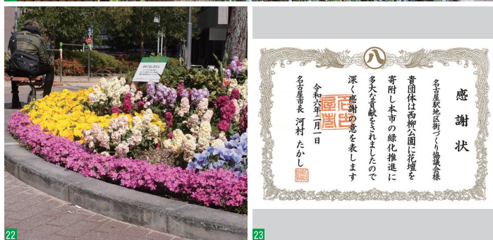
18:全国エリアマネジメントネットワーク総会 19:新幹線札幌駅東地区まちづくり勉強会 視察・ヒアリング対応 20:名古屋駅地区防災講演会 21:感謝状贈呈式 22:西柳公園花壇整備 23:感謝状受領