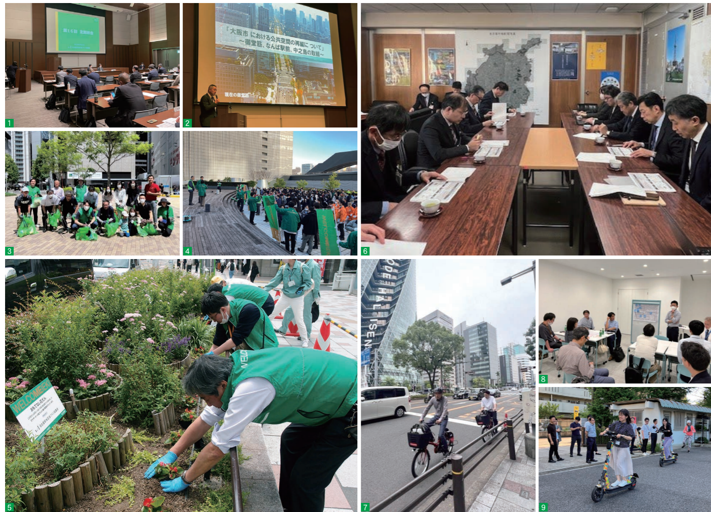
1:総会 2:講演会 3:名古屋市クリーンキャンペーン 4:年末クリーンキャンペーン 5:おもてなし花だん花植え 6:名古屋市へ提案書の提出 7・8:自転車走行空間の体験・意見交換 9:電動キックボード試乗 10-11:「あたらしい駅前空間づくり」ワークショップ 12:大水害机上演習 13:西柳公園 喫煙マナー向上施策 14:富山市ヒアリング 15:大阪視察 16:SNSフォトキャンペーン「メイエキ賞」 17:名古屋駅地区 打ち水大作戦2023