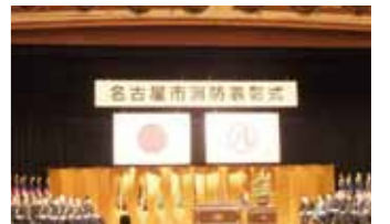
名古屋市消防表彰式(1/31)