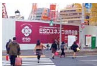
ESDユネスコ世界会議(11月)