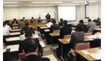
なごや交通まちづくりプラン(素案)説明会