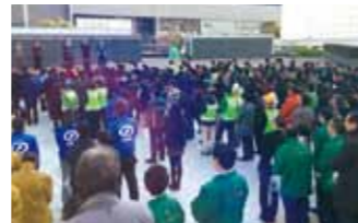
年末クリーンキャンペーン(12/11)