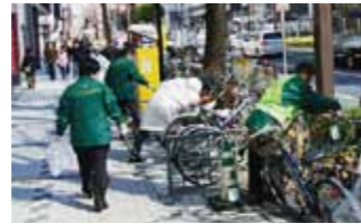
清掃、違法駐輪対策