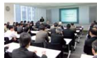
活動報告会 3/29 開催