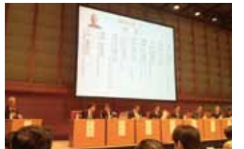
環境まちづくりフォーラム in 東京