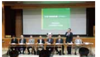
中村区政トップセミナー