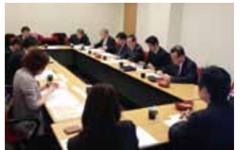
大丸有ヒアリング