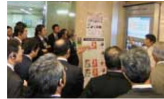
街歩き (地下街探索)