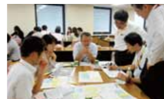
ワークショップ 6/5 開催