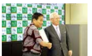
パートナーシップ協定

名古屋駅地区における防災・減災まちづくりに向けた協力連携に関する協定書 (名古屋市)