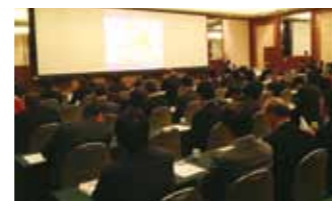
セミナー 1/29 開催