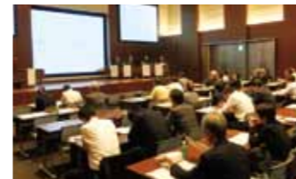
環境まちづくりフォーラム 10/3 開催