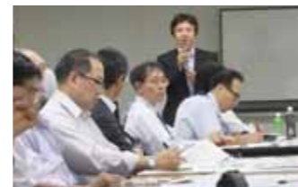
勉強会 6/17 開催