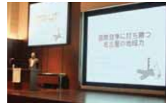
シンポジウム・講演会