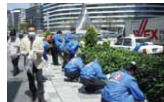
清掃活動・違法駐輪対策