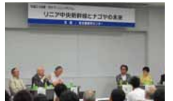
シンポジウム「リニア中央新幹線とナゴヤの未来」