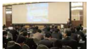
セミナー 1/31 開催