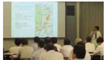
勉強会 9/13 開催