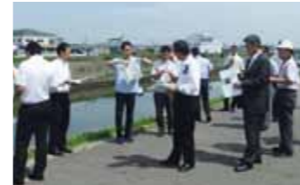
エクスカージョン