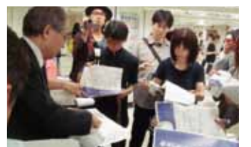
名古屋駅地下街でツアー!