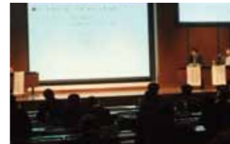
シンポジウム・講演会