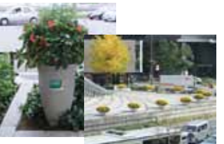
花と緑のおもてなしメイエキ2010