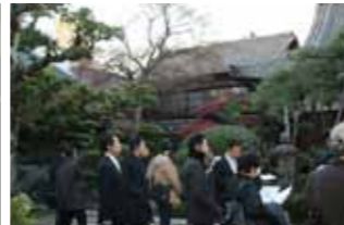
街歩き 旧笈瀬川筋コース