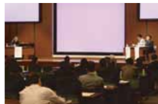
シンポジウム・講演会