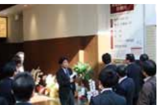
高松丸亀町商店街視察