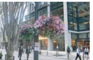
大丸有、日本橋視察