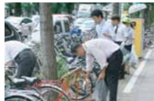
清掃活動・違法駐輪対策