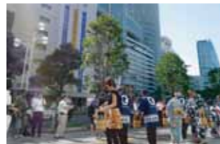
名古屋駅地区打ち水大作戦