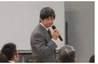
勉強会 1/28 開催