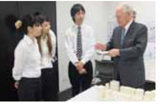
勉強会 7/30 開催