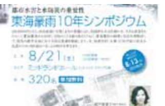
東海豪雨10年シンポジウム