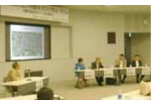
まちのにぎわいとごやの交通のあり方について考えるシンポジウム