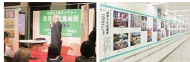
世界の子どもギャラリー～世界の児童画展～